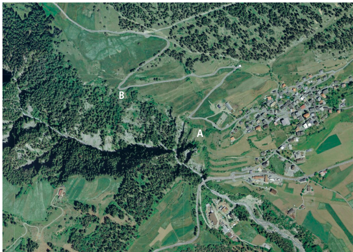
Abb. 2: Die untersuchten Kugelginster-Beständen A und B am Ausgang des Val Sinestra.

Im Vergleich dazu erreicht der Deckungsgrad von Genista radiata im Bestand B teilweise 90 %; entsprechend niedriger ist die Gesamtartenzahl mit 4 bis 13 Arten und der Anteil der Trockenrasenelemente. Brachypodium pinnatum ist hier die häufigste Begleitart (Abb. 3).