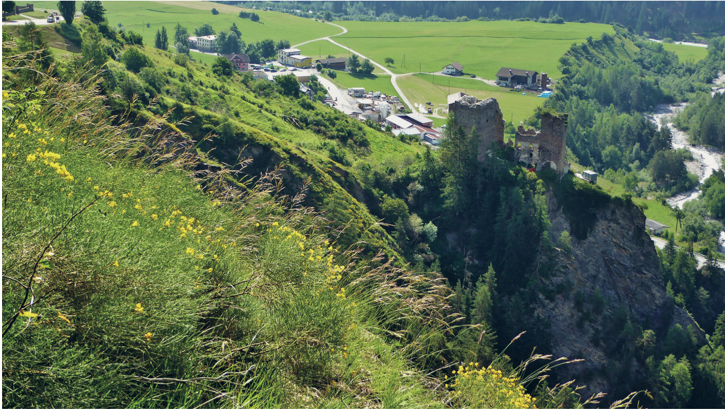
Abb. 3: Genista radiata -Bestand (gemeinsam mit Brachypodium pinnatum ) oberhalb der Burg-ruine Tschanüff. Foto T. Peer, Juli 2016