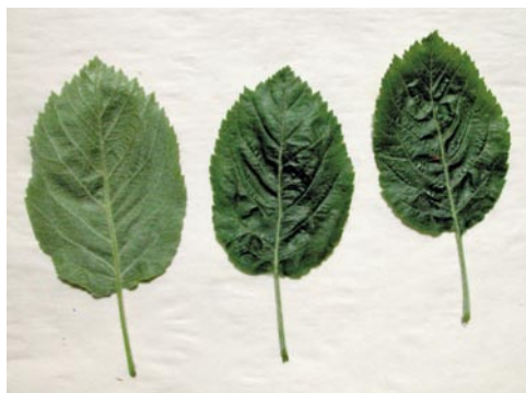
Fig. 2: Feuilles de Sorbopyrus auricularis (M. Hoff 8207)