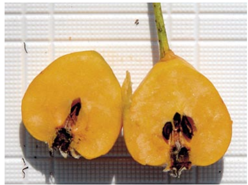
Fig. 5: Coupe du fruit

jaune-orangé, douce et sucrée, peu parfumée, à odeur douceâtre et à consistance de pomme farineuse (parfois à saveur de coing), pépins non fertiles. Fleur: avril à mai; fruit: mi-août à octobre.