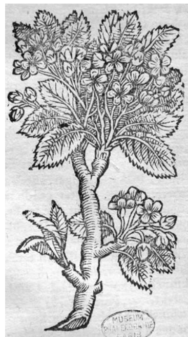
Fig. 1: Gravure de Pirus polvilleriana