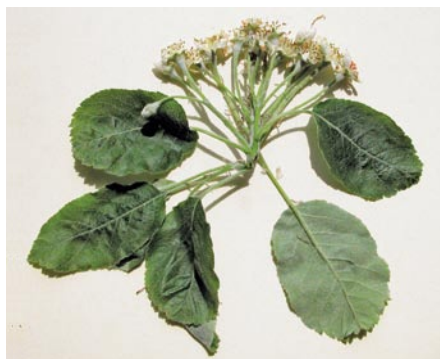
Fig. 3: Inflorescence de Sorbopyrus auricularis (M. Hoff 8207)