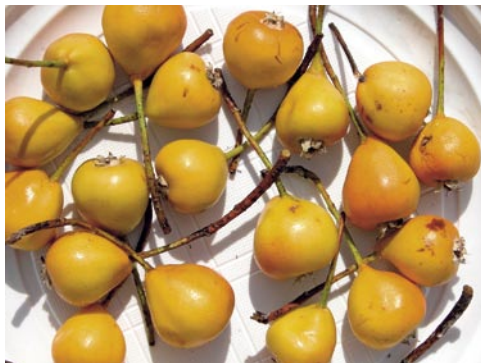
Fig. 4: Les «poires de Bollwiller», fruits du Sorbopyrus auricularis