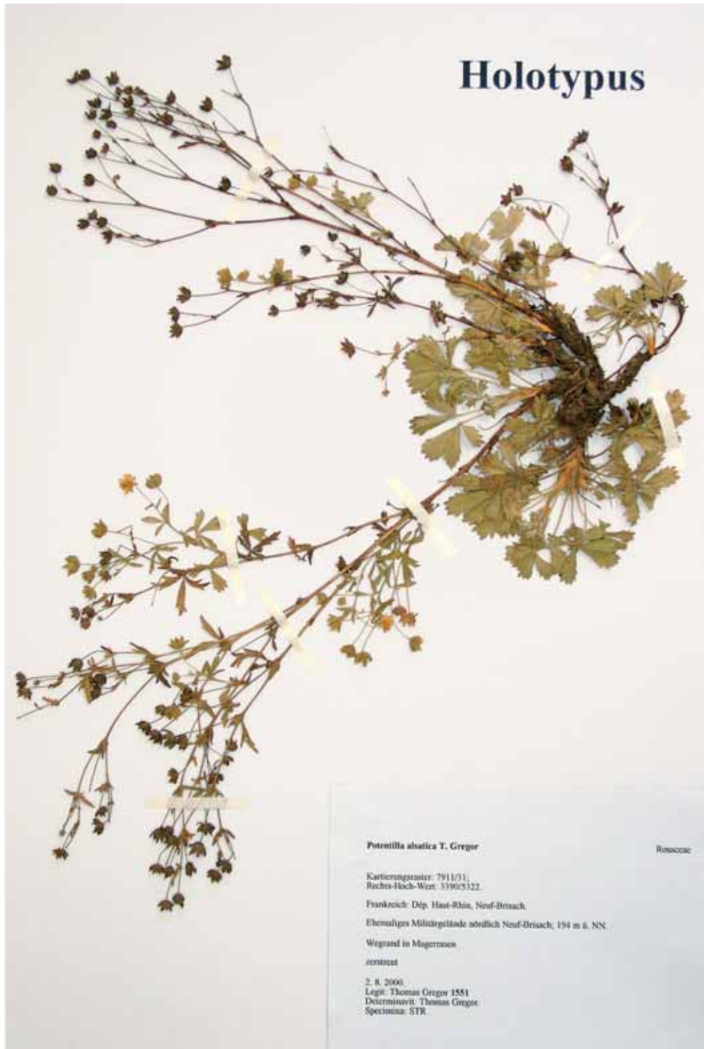
Abb. 1: Holotypus von Potentilla alsatica T. Gregor