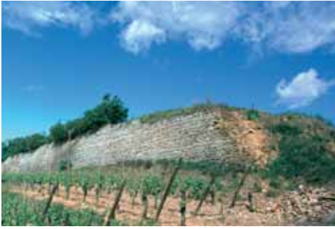
Abb. 4: Fundort von Potentilla alsatica auf dem Letzenberg, 14. 5. 2002. Der kleine Bestand befindet sich auf dem rechten Randbereich der Mauer.