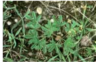
Abb. 2: Grundblattrosette von Potentilla alsatica . Neuf-Brisach, 27. 7. 2001.

Caudex multiceps , tempore florendi surculis brevibus sterilibus. Folia radicalia et caulina inferna mediaeque 5(–7)-nata, concava, apice rubro, margo in plantas vivas incrassatus in plantas exsiccatas revolutus, supra modice pilis rectis 0,4–0,8 mm longis, subtus ± virescentes ad nervos pilis rectis usque 1,3 mm longis inter nervos modice pilis crispis; petioli plerumque 3–5 cm longi, modice pilis curtis flexuosis et usque 1,8 mm longis rectis; folioli terminales concavi, anguste obovati, plerumque 2–2,5(–3) cm longi, a medio incisi-serrati dentibus utrinque (3–)4–5, dente terminali vulgo non exserto. Stipulae infimae auriculis linearibus et profunde pilis longis rectis, stipulae caulinae auriculis obliquis ovatis acutis. Folia caulina supera 3-nata foliolo terminali antice manifeste lato dentibus plerumque 3. Caules ascendentes multiflori (saepae > 50) plerumque a inferno parte ramosi pilis curtis flexuosis et longis ± rectis. Flores circa 10 mm diametro, pedunculis 10–15 mm longis saepe curvatis pilis flexuosis et percurtis