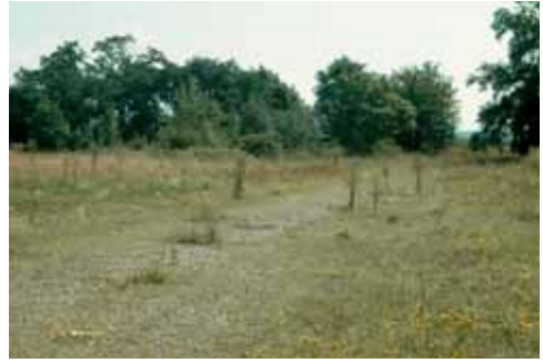
Abb. 5: Ehemaliges Militärgelände nördlich von Neuf-Brisach mit Schotterpisten, 27. 7. 2001. Potentilla alsatica wächst auf ehemaligen Fahrwegen.