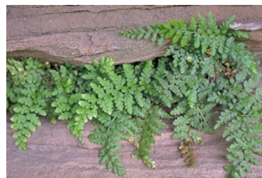
Fig. 1: Asplenium obovatum subsp. lanceolatum .

Sur grès vosgien, environs de Saverne (Bas-Rhin), juillet 1999